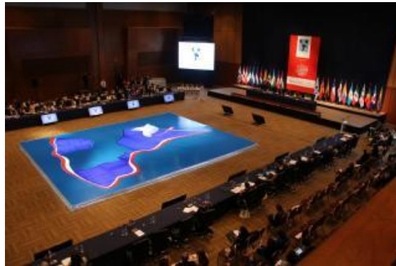
Asamblea Plenaria de la XVIII Cumbre Judicial Iberoamericana. Asunción, Paraguay, abril de 2016

La Cumbre Judicial Iberoamericana es una organización que articula la cooperación y concertación entre los Poderes Judiciales de los veintitrés países de la comunidad iberoamericana de naciones, aglutinando en un solo foro a las máximas instancias y órganos de gobierno de los sistemas judiciales iberoamericanos. Reúne en su seno a los Presidentes de las Cortes Supremas y Tribunales Supremos de Justicia y a los máximos responsables de los Consejos de la Judicatura iberoamericanos.