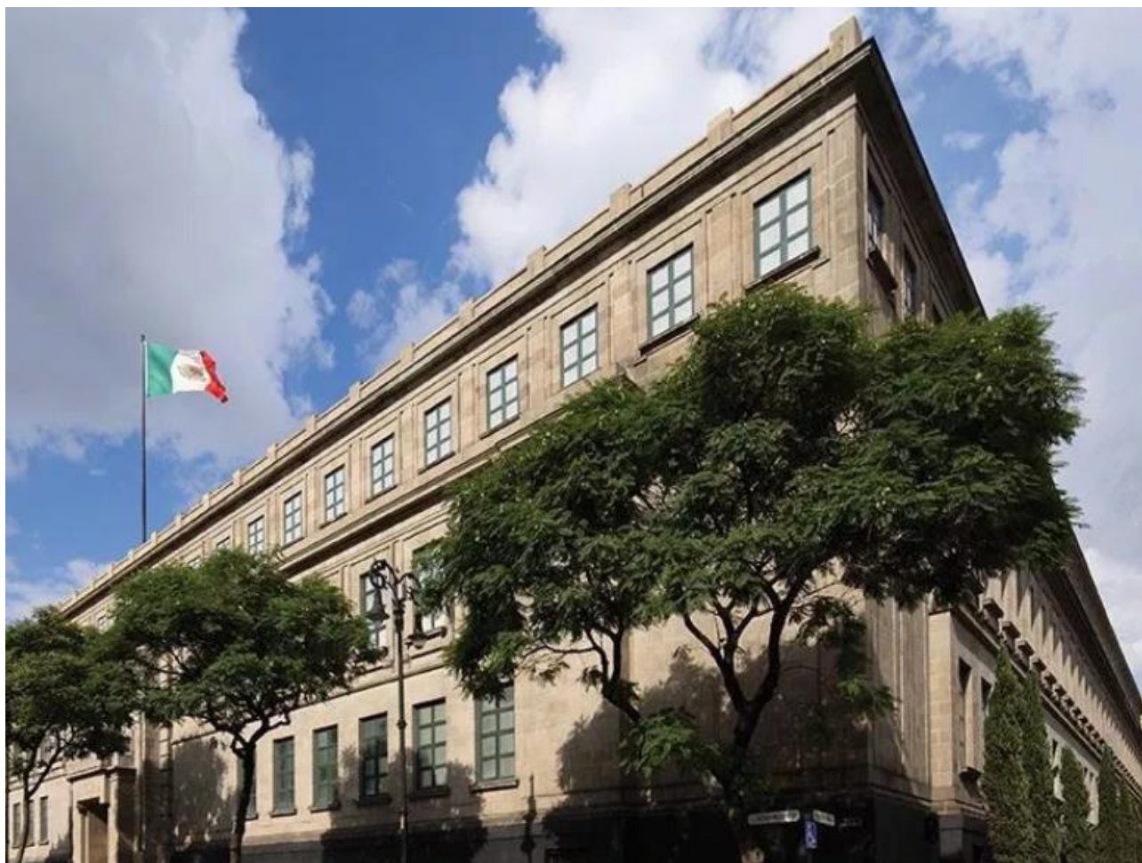
Edificio Sede de la Suprema Corte de Justicia de la Nación de México