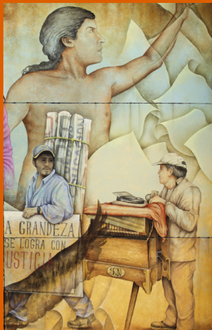
Fragmento de la obra “En búsqueda de la Justicia” del Maestro Ángel Ismael Ramos SCJN

Febrero 20. Día Mundial de la Justicia Social