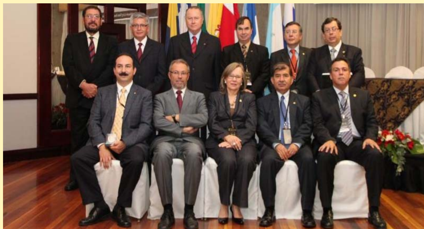
Sobre estas líneas, una imagen de los asistentes a la I Reunión de Comisión Iberoamericana de Calidad para la Justicia, celebrada entre los días 7 y 8 de febrero en San José de Costa Rica.

Gran parte de las sesiones de trabajo fueron destinadas a consolidar el estatuto de la Red Iberoamericana de Gestión e Investigación de Calidad para la Justicia (RIGICA-JUSTICIA) para lo cual se analizó artículo por artículo, lográndose la consolidación unánime por parte de los integrantes de la CICAJ, de dicho cuerpo estatutario. Estos estatutos serán aprobados en la Segunda Reunión Preparatoria, que tendrá lugar en el mes de diciembre en Bolivia.