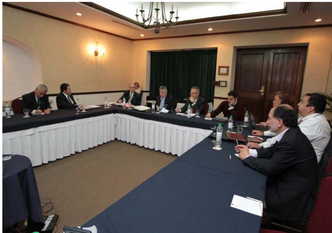
Comisión Permanente de Coordinación y Seguimiento de la XVII Cumbre