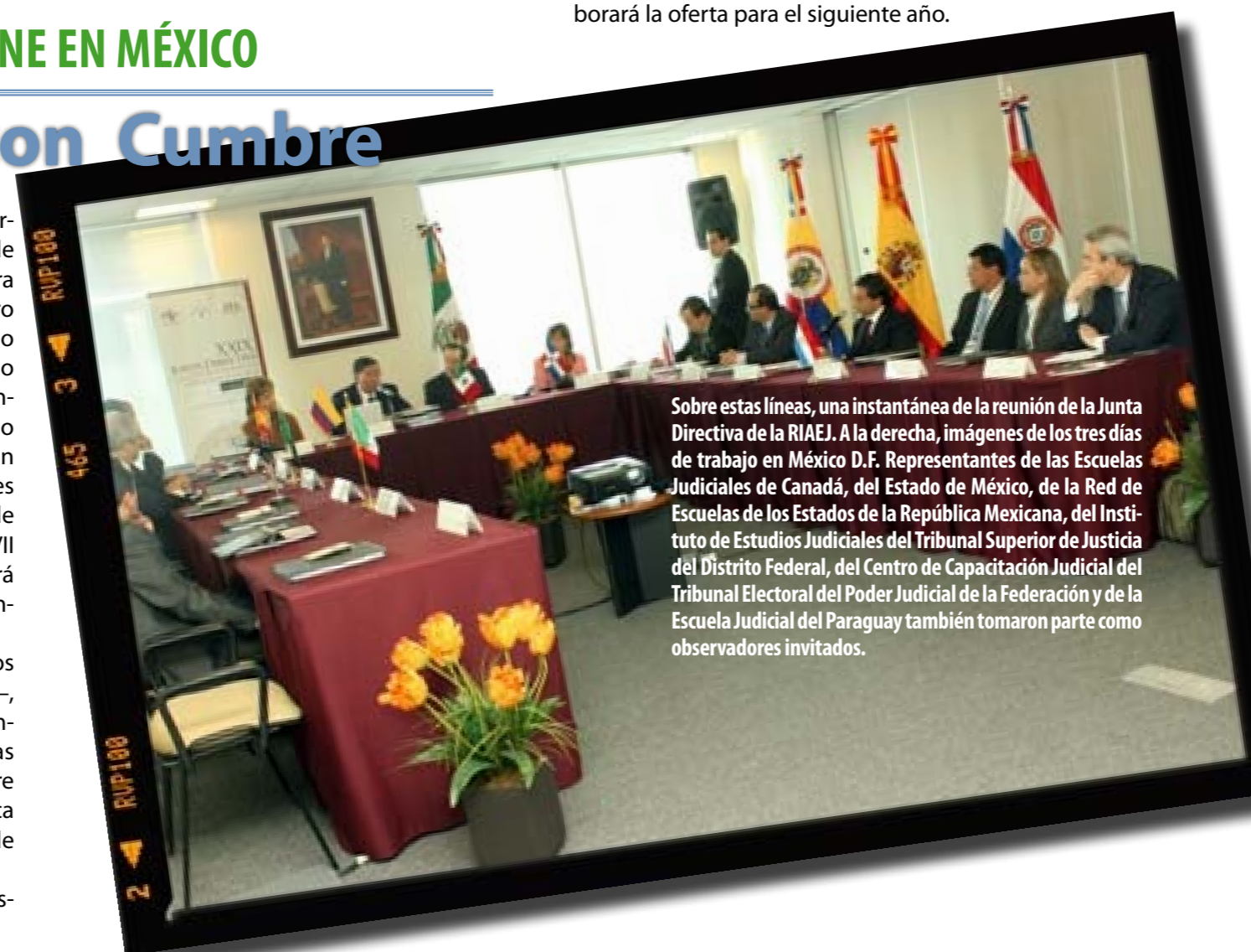
Sobre estas líneas, una instantánea de la reunión de la Junta Directiva de la RIAIEJ. A la derecha, imágenes de los tres días de trabajo en México D.F. Representantes de las Escuelas Judiciales de Canadá, del Estado de México, de la Red de Escuelas de los Estados de la República Mexicana, del Instituto de Estudios Judiciales del Tribunal Superior de Justicia del Distrito Federal, del Centro de Capacitación Judicial del Tribunal Electoral del Poder Judicial de la Federación y de la Escuela Judicial del Paraguay también tomaron parte como observadores invitados.

Por otra parte, el eje 5, “Construcción de una oferta formativa de la RIAIEJ”, que tiene como objetivo establecer un sistema que propicie la cooperación horizontal entre las escuelas judiciales, tendrá, en la próxima reunión de la Junta Directiva, un sistema de coordinación que incluya el método y selección de participantes, los cursos presenciales y a distancia y la posibilidad de pasantías. La Junta Directiva se constituirá en la Comisión Pedagógica y en la reunión de España, en el marco de Aula Iberoamericana, se elaborará la oferta para el siguiente año.