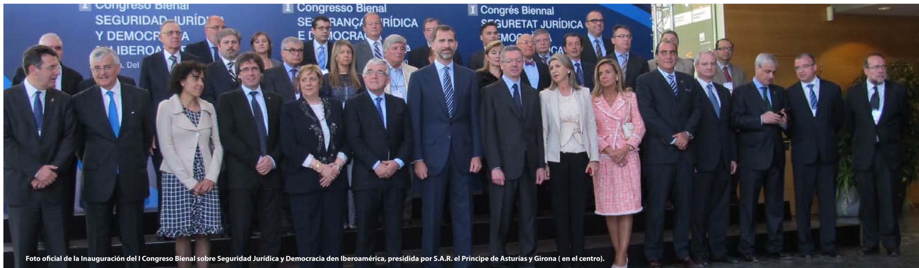
Foto oficial de la Inauguración del I Congreso Bienal sobre Seguridad Jurídica y Democracia den Iberoamérica, presidida por S.A.R. el Príncipe de Asturias y Girona ( en el centro).

S. A. R. el Príncipe de Asturias y de Girona, inauguró I Congreso Bienal: Seguridad Jurídica y Democracia en Iberoamérica . Junto a él estuvieron el presidente del Tribunal Supremo y del Consejo General del Poder Judicial, Gonzalo Moliner, el ministro de Justicia, Alberto Ruiz Gallardón, el fiscal general del Estado, Eduardo Torres-Dulce y destacadas personalidades del mundo judicial iberoamericano.