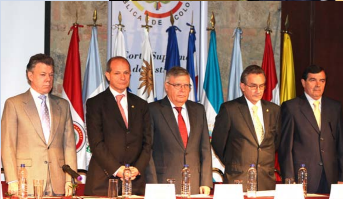
El presidente de Colombia, Juan Manuel Santos, en la sesión inaugural de este importante foro judicial Iberoamericano, celebrado en el Museo Nacional de Colombia, uno de los edificios más imponentes de Bogotá; antes fue la Penitenciaría Central de la capital del país.