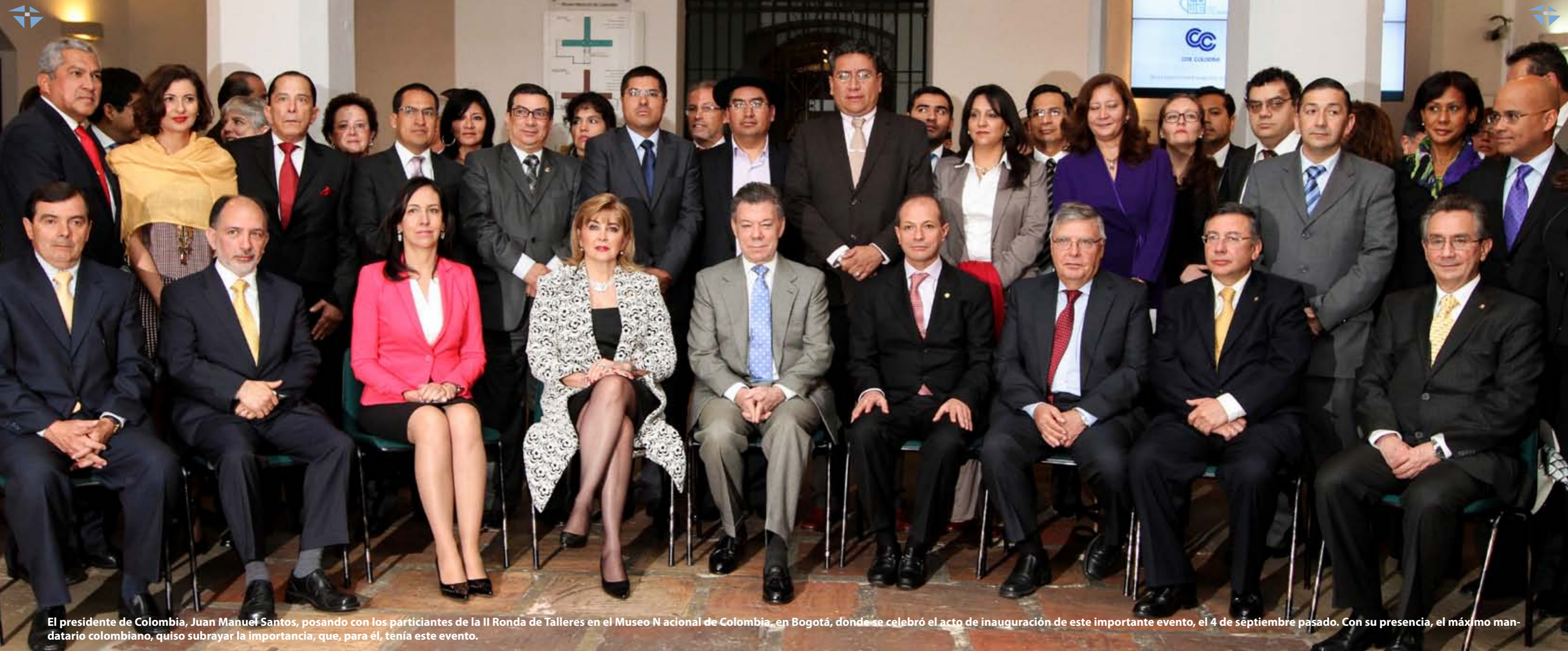
El presidente de Colombia, Juan Manuel Santos, posando con los participantes de la II Ronda de Talleres en el Museo Nacional de Colombia, en Bogotá, donde se celebró el acto de inauguración de este importante evento, el 4 de septiembre pasado. Con su presencia, el máximo mandatario colombiano, quiso subrayar la importancia, que, para él, tenía este evento.