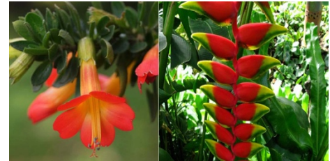
Kantuta y Patuju: Símbolos oficiales del Estado Plurinacional de Bolivia

En Bolivia el voltaje común es 220 v. La frecuencia entre 50 a 60 hz. Las clavijas y enchufes son del tipo de corriente ALTERNA.