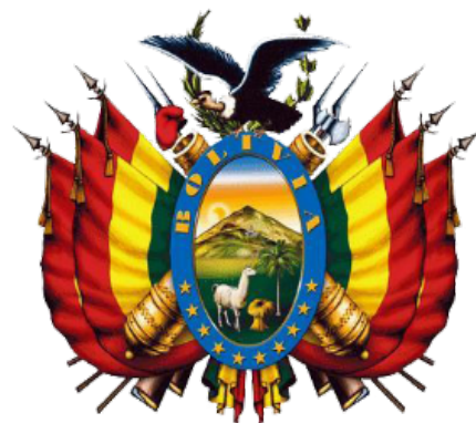
Escudo del Estado Plurinacional de Bolivia

El boliviano es la moneda de curso legal de Bolivia desde el año 1987. Se divide en 100 centavos y entró en circulación nacional, reemplazando al antiguo peso boliviano. El Banco Central de Bolivia, es el organismo económico responsable de la emisión de la moneda.