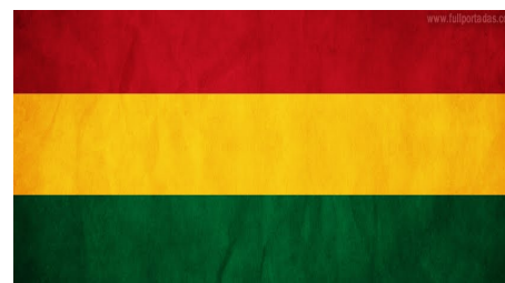
Tricolor: Bandera oficial del Estado Plurinacional de Bolivia