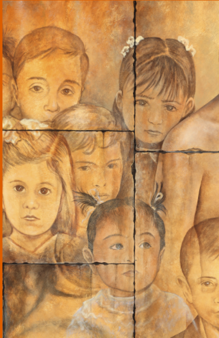
Fragmento de la obra "En búsqueda de la Justicia" del Maestro Ángel Ramos SCJN