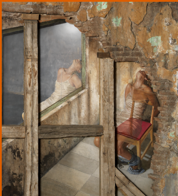
Fragmento del mural "Represión" pintado por Rafael Cauduro SCJN

Septiembre 28. Día Internacional por los Derechos Sexuales y Reproductivos