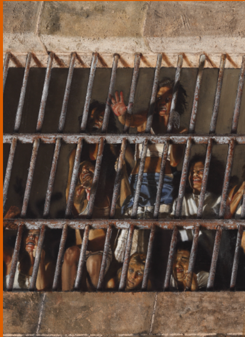
Fragmento del mural "Represión" pintado por Rafael Cauduro SCJN

Julio 30. Día Internacional Contra la Trata de Personas