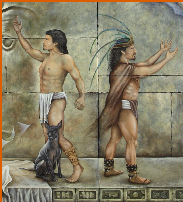
Fragmento de la obra "En búsqueda de la Justicia" del Maestro Ángel Ismael Ramos SCJN