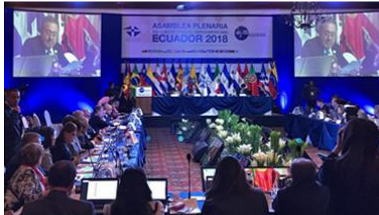
Asamblea Plenaria de la XIX Edición Cumbre Judicial Iberoamericana. Quito, Ecuador, abril de 2018

La Cumbre Judicial Iberoamericana ( www.cumbrejudicial.org ), es una organización que articula la cooperación y concertación entre los Poderes Judiciales de los veintitrés países de la comunidad iberoamericana de naciones, aglutinando en un solo foro a las máximas instancias y órganos de gobierno de los sistemas judiciales iberoamericanos. Reúne en su seno a los Presidentes de las Cortes Supremas y Tribunales Supremos de Justicia y a los máximos responsables de los Consejos de la Judicatura iberoamericanos.