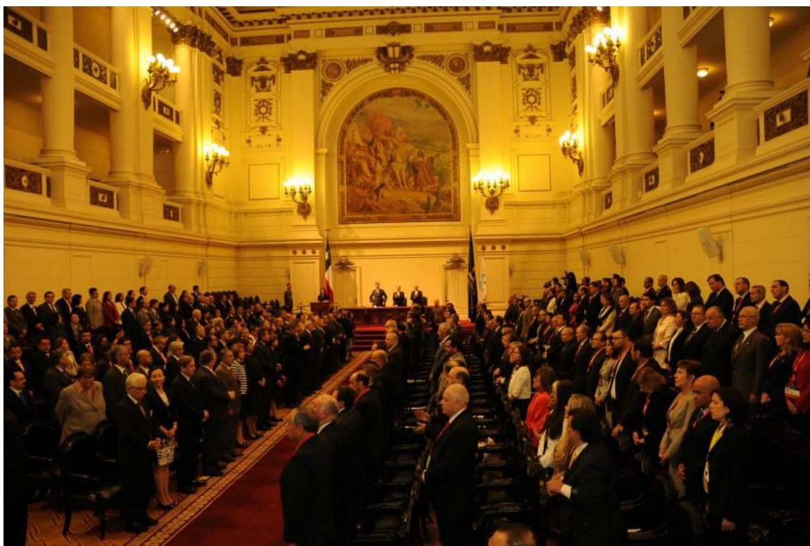
Asamblea Plenaria de la XVII Cumbre Judicial Iberoamericana. Santiago de Chile, Abril de 2014

La Cumbre Judicial Iberoamericana ( www.cumbrejudicial.org ), es una organización que articula la cooperación y concertación entre los Poderes Judiciales de los veintitrés países de la comunidad iberoamericana de naciones, aglutinando en un solo foro a las máximas instancias y órganos de gobierno de los sistemas judiciales iberoamericanos. Reúne en su seno a los Presidentes de las Cortes Supremas y Tribunales Supremos de Justicia y a los máximos responsables de los Consejos de la Judicatura iberoamericanos.