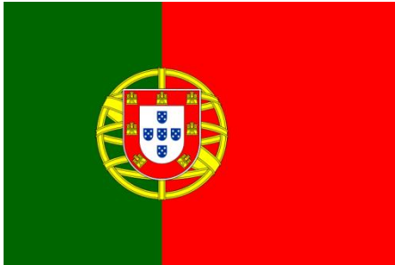
(Bandeira de Portugal)