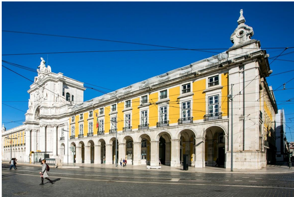
Fachada do Edifício do Supremo Tribunal de Justiça - Portugal

O Supremo Tribunal de Justiça é o tribunal mais elevado da hierarquia dos tribunais comuns. Compete-lhe, em última instância e em nome do povo, administrar a justiça em Portugal.