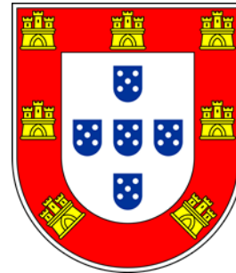
(Escudo de Portugal)

Nome: Portugal (oficialmente, República Portuguesa)