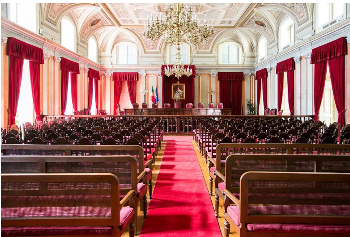
Salão Nobre do Supremo Tribunal de Justiça – Praça do Comércio, Lisboa

(Devido a obras, pode dar-se uma alteração de local. Nesse Caso, as secretarias e os delegados serão informados com a maior antecedência.)