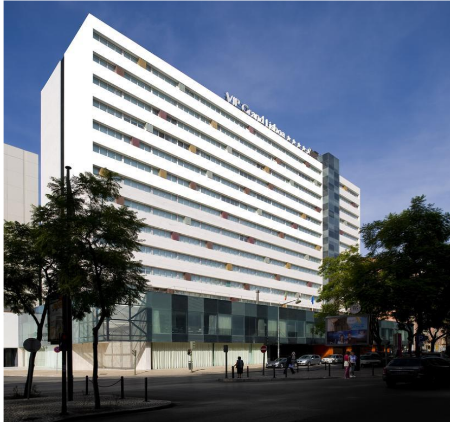
O VIP Grand Lisboa Hotel, onde ficam hospedados os delegados na Avenida 5 de Outubro, 197, em Lisboa

O Supremo Tribunal de Justiça e o Conselho Superior da Magistratura farão as reservas e assegurarão o alojamento no VIP Grand Lisboa hotel por 4 noites – 17, 18, 19 e 20 de Março de 2019 – para um total de 52 pessoas que incluem: 1 perito delegado por país por cada grupo de trabalho em que o país tenha representação no máximo de 10 por grupo, assim como a 1 representante da Secretaria Permanente e 1 representante da Secretaria Pro Tempore, e ainda aos membros da Comissão de Coordenação e Seguimento e dois delegadas da Comissão de Género e Acesso à Justiça, que realizarão a sua reunião no âmbito da Segunda Ronda de Trabalhos – e alimentação de todos os delegados durante os 3 dias do evento, assim como a deslocação entre o Aeroporto Humberto Delgado (Lisboa) e o VIP Grand Lisboa Hotel e vice-versa, de todos os presentes na reunião).