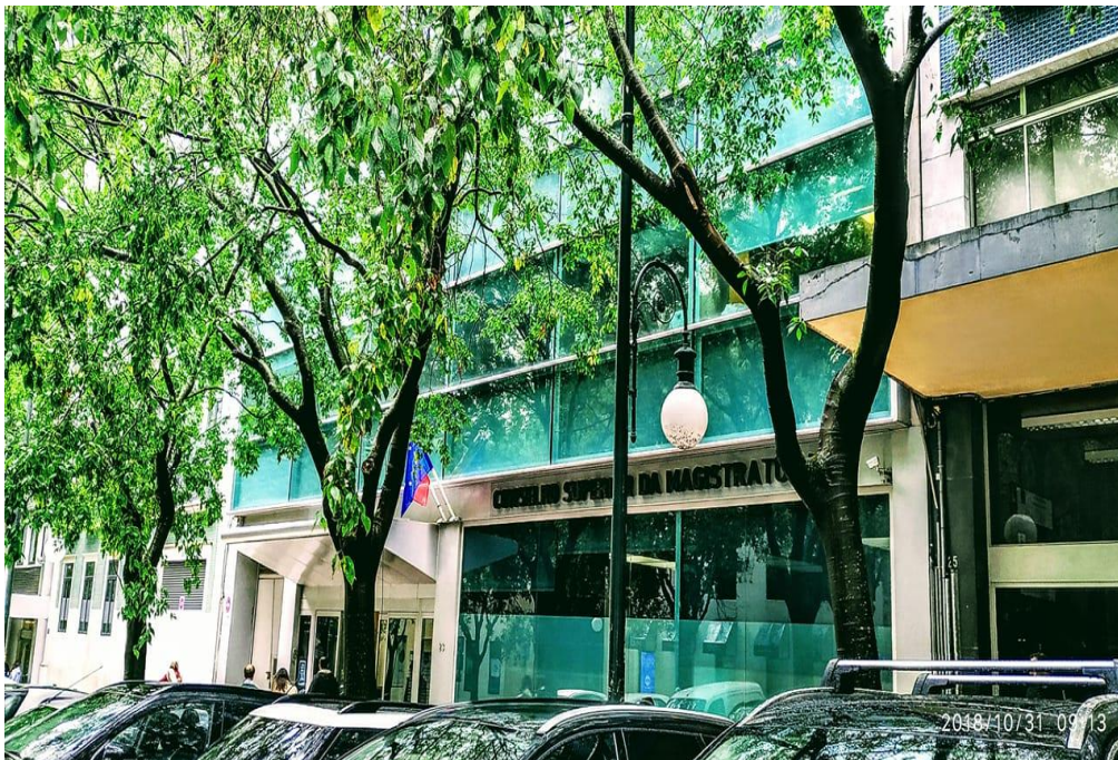
Fachada do Conselho Superior da Magistratura

As reuniões da Segunda Ronda de Trabalhos levar-se-ão a cabo na sede do Conselho Superior da Magistratura, na cidade de Lisboa (Rua Duque de Palmela, nº23).