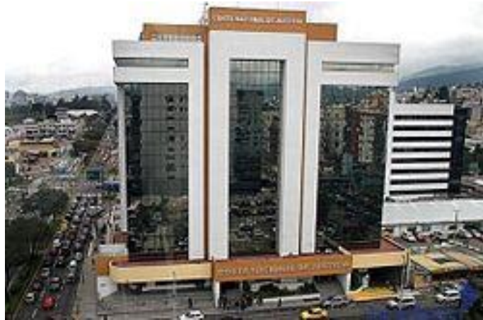
Corte Nacional de Justicia