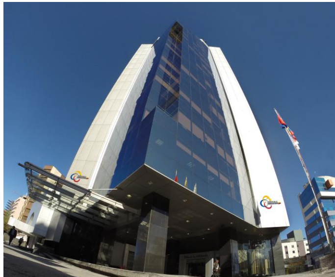
Consejo de la Judicatura