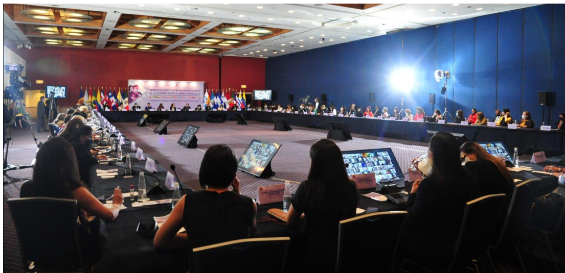
Primera Reunión Preparatoria - Ciudad de México, México 2022

El presente documento está destinado a proveer al lector de información básica o introductoria sobre la Cumbre Judicial Iberoamericana.