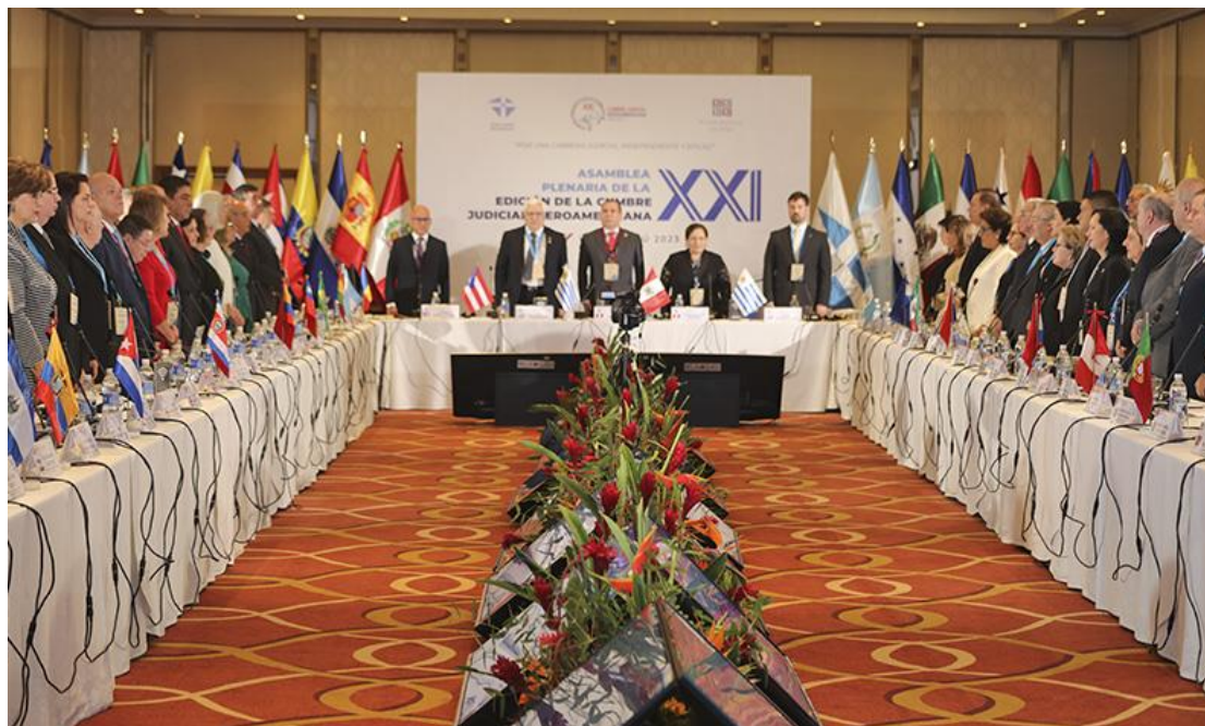
Asamblea Plenaria de la XXI Cumbre Judicial Iberoamericana. Lima, Perú, setiembre de 2023

La Cumbre Judicial Iberoamericana es una organización que articula la cooperación y concertación entre los Poderes Judiciales de los veintitrés países de la comunidad iberoamericana de naciones, aglutinando en un solo foro a las máximas instancias y órganos de gobierno de los sistemas judiciales iberoamericanos. Reúne en su seno a los Presidentes de las Cortes Supremas y Tribunales Supremos de Justicia y a los máximos responsables de los Consejos de la Judicatura iberoamericanos.