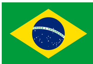
Bandera de Brasil